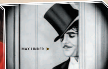
MAX LINDER ▶