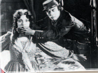
▲ KENRAALI ▲ SUSI-ISÄ