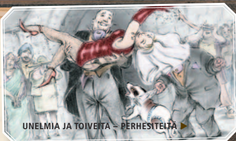
UNELMIA JA TOIVEITA – PERHESITEITÄ